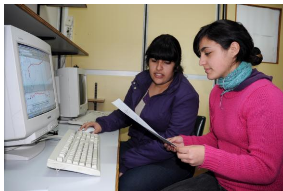
Experiencias didácticas 2009. Exactas, CABA.