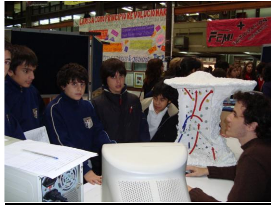
Semana Ciencias de la Tierra 2009. Exactas, CABA.