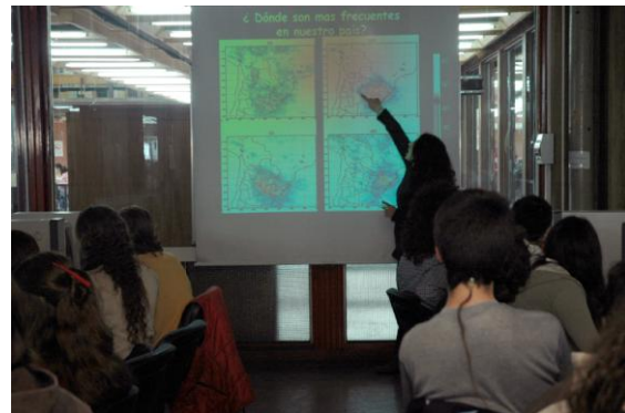
Taller de Ciencias 2009. Exactas, CABA.