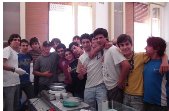
Bragado 2009. Pcia. de Bs. As.