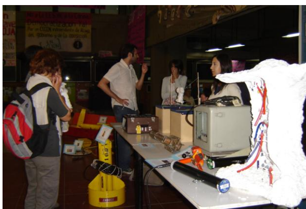
Noche de los Museos 2009. Exactas, CABA.