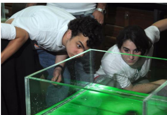
Científicos por un día 2009. Exactas, CABA.