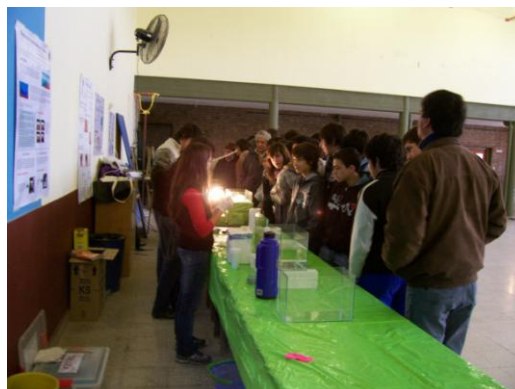
V Congreso de la Creatividad Juvenil en Ciencia y Tecnología 2009. San Cristóbal, Pcia. de Santa Fé.