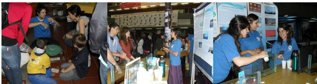
Foto de las mesas del TallEx durante la Noche de los Museos.

Volvimos a participar en la Noche de los Museos , actividad organizada por el Gobierno de la Ciudad de Buenos Aires. En esta decima edición que se llevó a cabo el día 9 de noviembre desde las 20 hs. hasta las 3 am. más de 1000 personas recorrieron los distintos stands que preparó la Facultad. El DCAO volvió a mostrar el museo “El tiempo en el Tiempo” y los experimentos del TallEx.