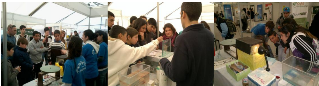
Stand de Exactas y la participación del TallEx durante la Feria de Ciencias en La Matanza

alumnos colaboraron en mostrar los experimentos del TallEx a gran cantidad de chicos y grandes interesados en las Ciencias.